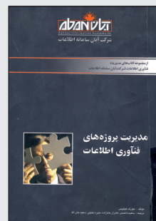
کتابخانه و مرکز اسناد و مدارک