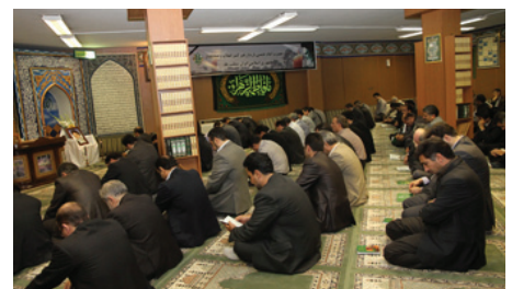
مراسم گرامی داشت بیست و دومین سالگرد ارتحال ملکوتی حضرت امام خمینی (ره) بنیانگذار جمهوری اسلامی ایران، روز پنجشنبه دوازدهم