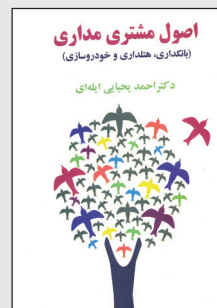
کتابخانه و مرکز اسناد و مدارک

لذا مشتری مداری روابط عمومی در سازمان‌های اقتصادی و در مفهوم چشم اندازی از مردممداری است.