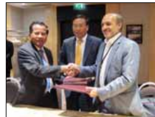
برگزاری شصت و سومین اجلاس کمیته اجرایی آپراکا