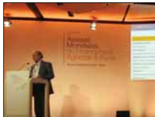
استقبال چشمگیر از تجربیات بانک کشاورزی در کنگره جهانی تامین مالی کشاورزی و روستایی