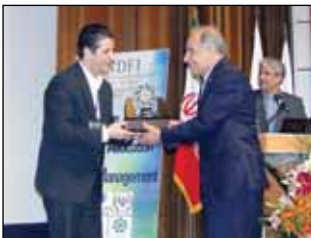
اهدای تندیس اولین همایش صندوق توسعه ملی به بانک کشاورزی