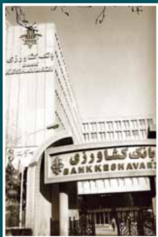
▲ سال ۱۳۵۹ تصمیم گرفته شد ساختمانی برای فعالیت های بانک کشاورزی مشخص شود. ساختمان مرکزی بانک کشاورزی واقع در بزرگراه جلال آل احمد نبش خیابان پاتریس لومونیا نعلک شد و به مدت سی سال خانه اصلی اهالی بانک کشاورزی شده است.

سمت منصوب می شد تا اینکه در نهایت سال ۱۳۵۸ با ادغام «بانک تعاون کشاورزی ایران» با «بانک توسعه کشاورزی»، «بانک کشاورزی» فعلی به وجود آمد. بانک