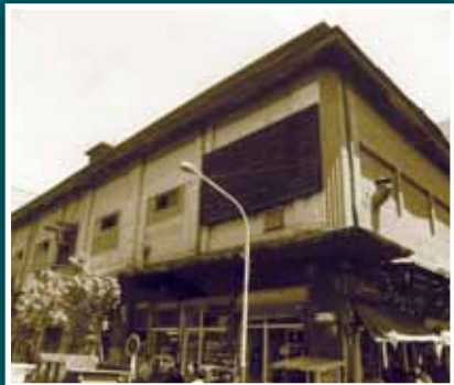
▲ قدیمی ترین ساختمان بانک کشاورزی در خیابان لاله زار قرار داشت. این ساختمان که از سال ۱۳۱۳ تا ۱۳۱۷ محل فعالیت گروه بانک کشاورزی بوده هنوز هم به عنوان یکی از بناهای قدیمی تهران در لاله زار پابرجاست.