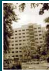
▶ نمای ورودی محل بانک کشاورزی و پیشه و هنر ایران

▼ البته سال ۱۳۳۷ تصمیم گرفته شد این مرکز به ساختمانی در خیابان ورزش اطراف پارک شهر منتقل شود. بانک کشاورزی تا سال ۱۳۵۹ در این خیابان قرار داشت.